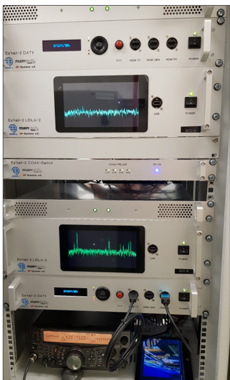
Unsere LEILA- und DATV-Bodenanlage im Satellite-Control-Center, Shelter