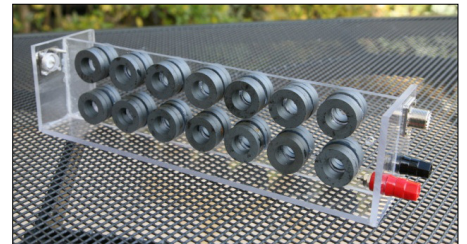
Bild A4: Trägergerüst für den Kellermann-Balun mit aufgeklebten Ringkernen