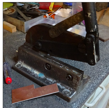
Das Platinenmaterial lässt sich gut mit einer Hebelschere zuschneiden.