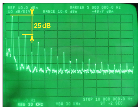
Bild A1: Spektrum eines 500-kHz-Sinussignals im Bereich bis 10 MHz

Ergänzend zum Beitrag präsentieren wir hier noch einige Bilder, die in der gedruckten Ausgabe keine Platz mehr fanden.